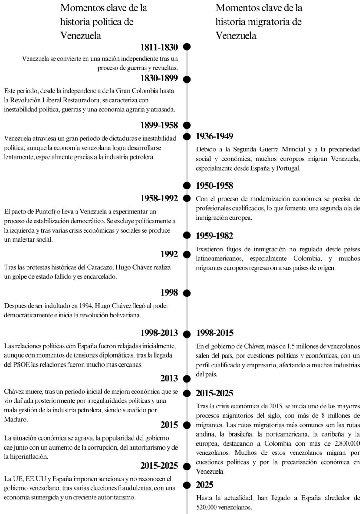
Ilustración 3: Línea del tiempo de la historia política y migratoria venezolana. Elaborada a partir del marco contextual.